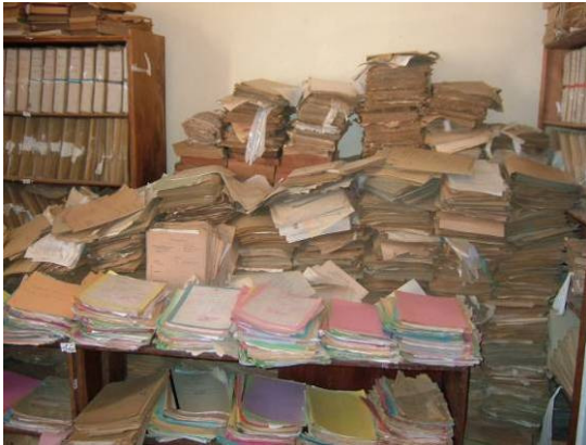
Archives du Cadastre du Complexe d'Ambre,

opération réalisée en 1994-95, financement Banque Mondiale, Cirdoma Diego