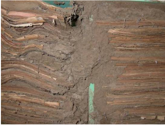
Conservation « termitée », Cirtapo Diego.