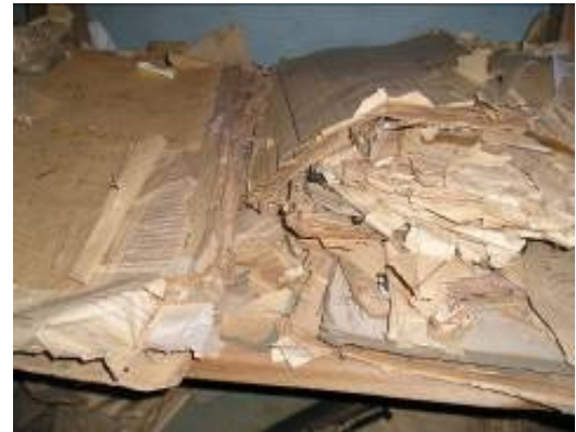
Livres fonciers, Cirdoma Manjakandriana

opération réalisée en 1994-95, financement Banque Mondiale, Cirdoma Diego