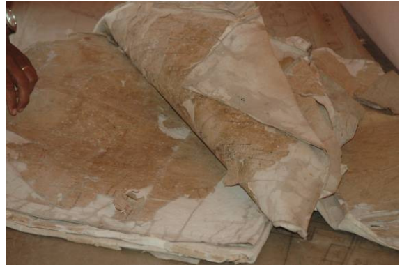
Plans de repérage, Cirtapo Vatamandry