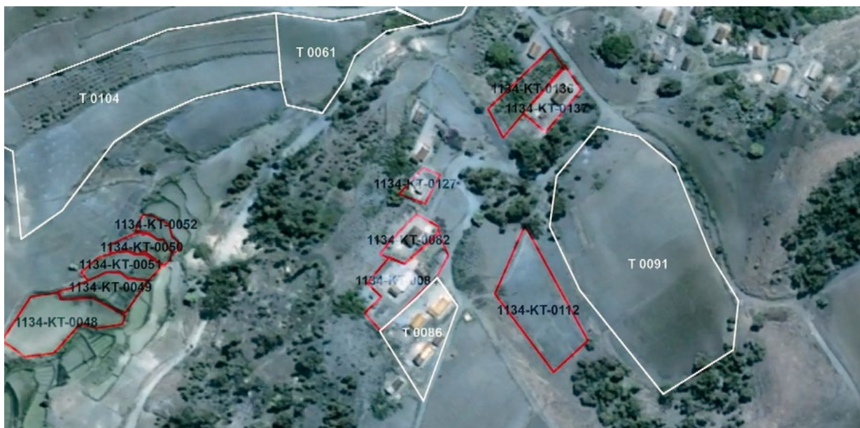
ILLUSTRATION 1 : Extrait de Plan local d'occupation foncière où apparaissent en blanc les limites de titres fonciers et en rouge celle des certificats

Ces deux systèmes de reconnaissance des droits sont soutenus par des acteurs de pouvoir socio-économique et politique très contrastés. Le système de l'immatriculation est défendu sur le terrain et dans les arènes de décision par des élites (cadres de l'adminis-