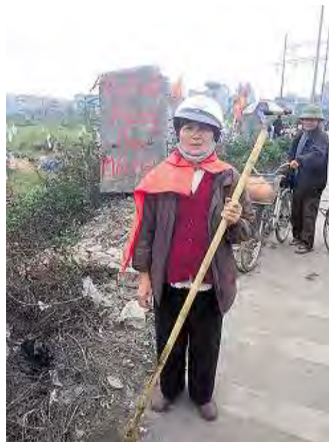
YVES DUCHÈRE. – « Plutôt mourir que perdre nos terres », Duong Noi, arrondissement de Ha Dong, Hanoï, Vietnam, 2013

formée en terrain constructible. « Sur les quatre mille mètres carrés que je possédais, ils m'ont laissé deux sao (5) [720 mètres carrés]. J'en ai vendu un à un bon prix et, avec l'argent, j'ai construit ma maison sur l'autre. »