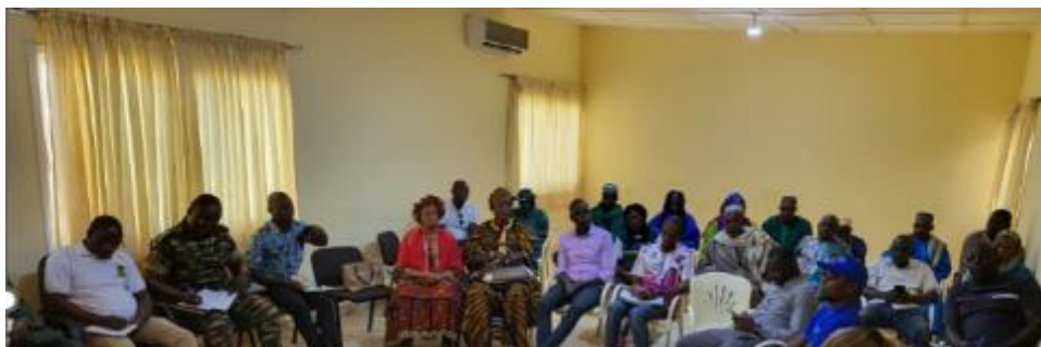
Réunion de concertation avec les acteurs de la Région du Tchologo, septembre 2025