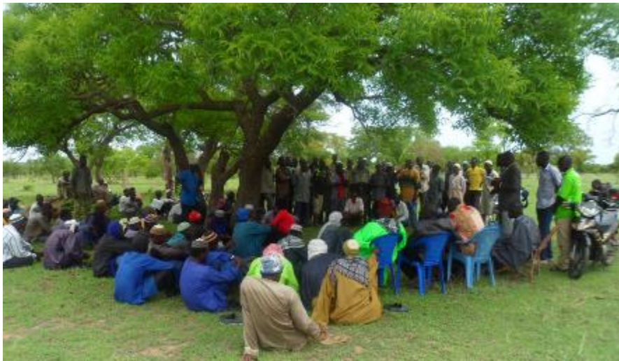
Cadre d'échanges avec les communautés hôtes de transhumants dans le nord du Togo

La capitalisation des expériences doit prioriser la sécurisation foncière, la gestion concertée des ressources et la prévention des conflits. Elle doit également documenter l'adaptation climatique et l'articulation entre politiques publiques et pratiques locales afin d'éclairer la décision et favoriser la diffusion des bonnes pratiques à long terme.