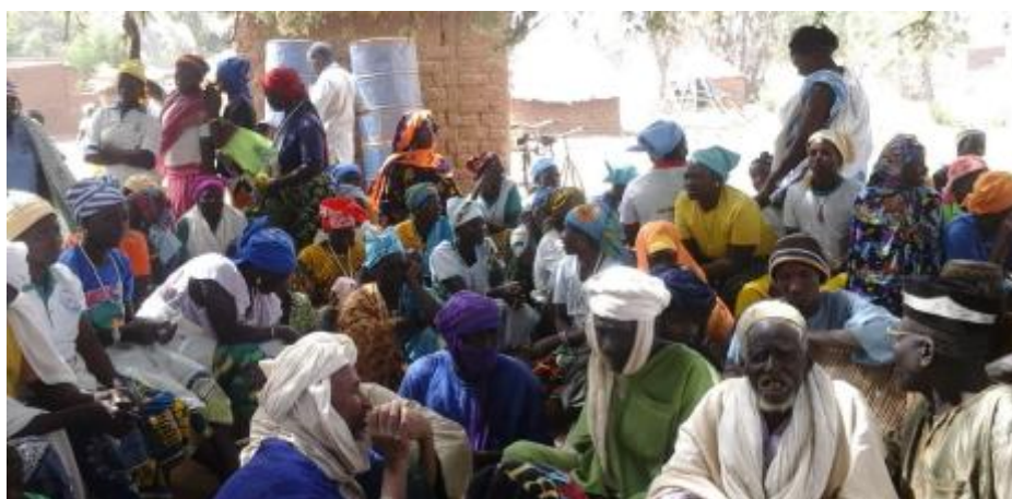
Rencontre intercommunautaire dans l'espace transfrontalier Togo–Burkina Faso

Dans le cadre de l'élaboration de cette proposition, des concertations ont été menées avec nos partenaires des Organisations Pastorales Régionales (OPR). Ces derniers identifient ce chantier comme un levier stratégique pour décliner et traduire concrètement, à l'échelle de territoires ciblés, les engagements issus de Nouakchott+10, en vue d'en assurer une mise en œuvre effective et mesurable. Il convient dès lors de mettre en évidence la cohérence stratégique entre les engagements portés par les OPR dans leur note de positionnement d'Abidjan – Note de position des acteurs de la société civile au forum de haut niveau sur le pastoralisme dix ans après la déclaration du Nouakchott « Nouakchott +10 » – et ceux réaffirmés dans la Déclaration de Nouakchott+10. Il importe en particulier d'examiner les engagements relatifs à la sécurisation du foncier agropastoral et au renforcement de la gouvernance territoriale, afin d'assurer leur articulation et leur portée opérationnelle.