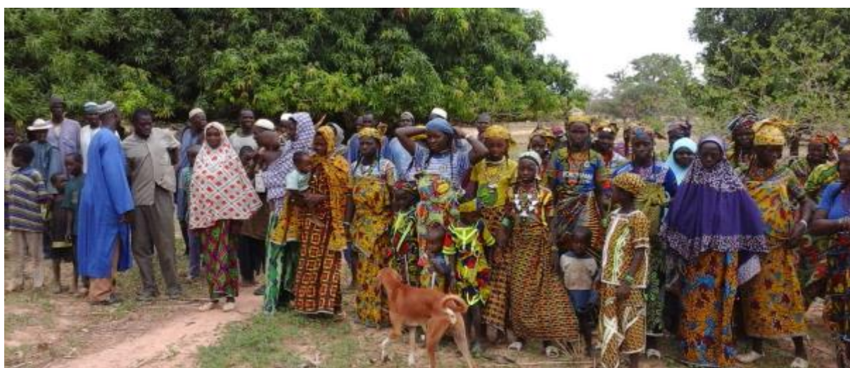
Réunion d'une communauté hôte de transhumants dans la région de la Kara, au Togo