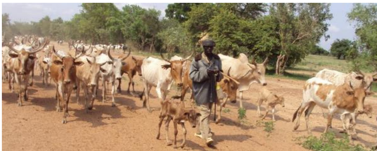
Un transhumant burkinabè entre au Togo avec son cheptel par le corridor de Cinkassé

Enfin, si ces constats mettent en évidence des défis communs à l'échelle de la zone du Golfe de Guinée, ils appellent néanmoins à une lecture différenciée et contextualisée, tenant compte des spécificités socio-foncieres, sécuritaires et institutionnelles propres à chaque territoire.