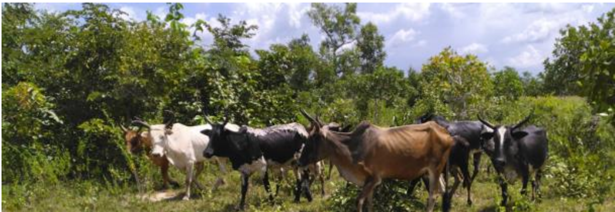
Troupeau à la pâture dans une jachère – région du Bounkani, septembre 2025