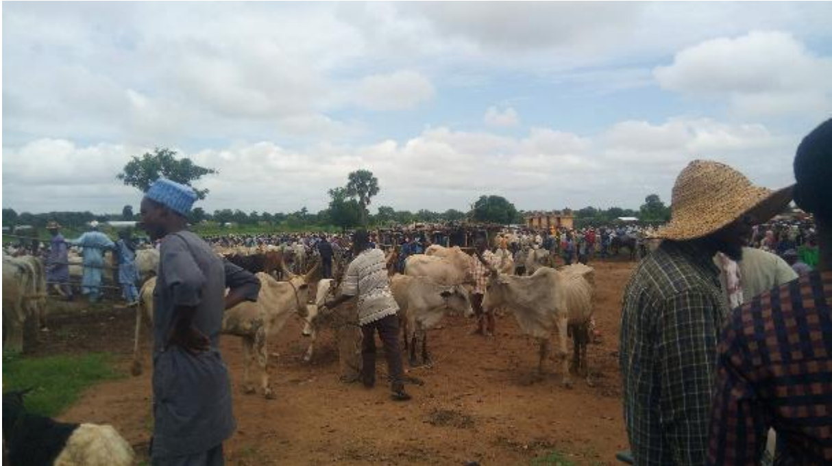
Marché à bétail au Nord de la Côte d'Ivoire, 2019

Ces dynamiques qui sont à l'œuvre dans les territoires du nord du Golfe de Guinée constituent des leviers de transformation significatifs. Toutefois, elles doivent être appréhendées à l'aune des enjeux stratégiques auxquels ces territoires sont confrontés, ainsi que des interactions entre les recompositions territoriales contemporaines, les dispositifs institutionnels qui les encadrent et les orientations de politiques publiques qui en conditionnent l'évolution.