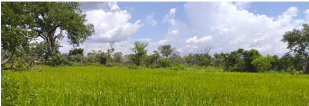
Région du Tchologo septembre 2025

Les deux organisations professionnelles partenaires APESS et RBM du consortium participent au cadrage de ces travaux et aux partages des résultats du chantier collectif. Ils se sont impliqués dans la préparation de cette proposition et ont mis à disposition les documents issus de leurs travaux sur la gouvernance des ressources naturelles dans la région concernée. Ils assument, en outre, la charge d'initier et de structurer la mobilisation des représentants de la société civile (pastorale et agricole) dans les territoires ciblés, puis d'organiser, coordonner et piloter les ateliers de partage et de concertation prévus sur le terrain. Leur rôle consiste également à identifier les initiatives et les bonnes pratiques mises en œuvre dans les territoires concernés, puis à les valoriser, afin de contribuer progressivement à l'amélioration de la gouvernance du foncier agropastoral et au renforcement de la cohésion sociale.