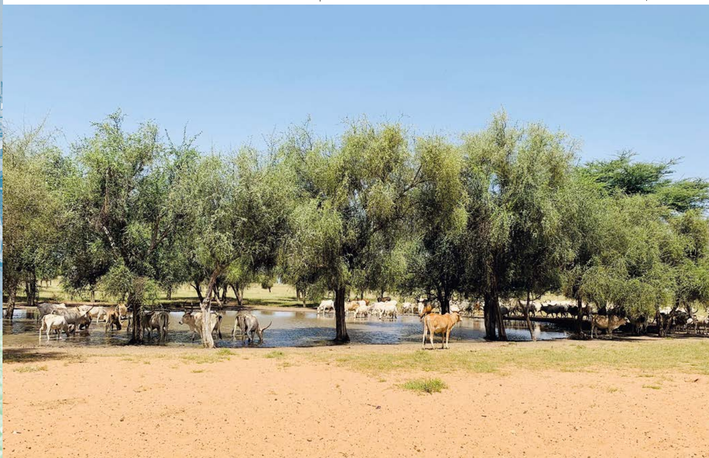
Troupeau bovin venant s'abreuver dans une mare dans le bas-fond de Goubéré au Burkina Faso, 2014