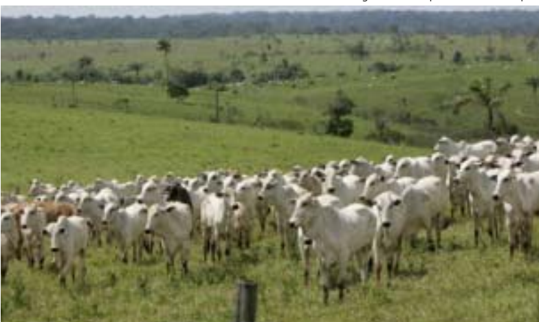
Élevage dans le département du Caquetá

La Colombie se caractérise par une répartition des ressources foncières la plus inégale au monde, et l'immobilisation sous forme d'élevage extensif de plus 15 millions d'hectares de terres cultivables, la plupart aux mains de groupes illégaux. Cette situation foncière s'explique par l'absence de réforme agraire, et ce malgré diverses initiatives et les attentes réelles du monde paysan. De plus, à partir des années 1960, l'État recule tandis que les