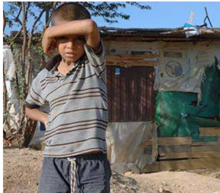
Déplacés colombiens

La loi accorde une attention particulière aux femmes et aux déplacés victimes du conflit. Elle a par ailleurs d'autres particularités : elle prévoit notamment des réparations collectives à des groupes ou des communautés, afrocolombiennes et indigènes notamment.