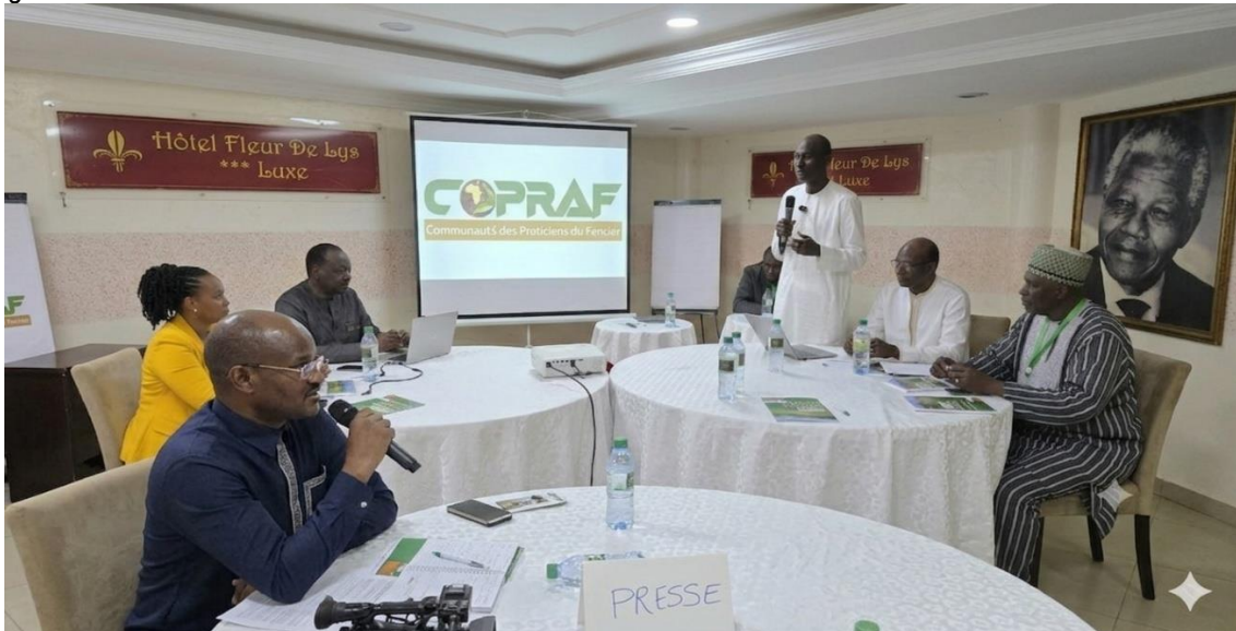
Panel : foncier & investissement organisé par la COPRAF (12 Décembre 2025 à l'hôtel Fleur de Lys, Dakar Sénégal)